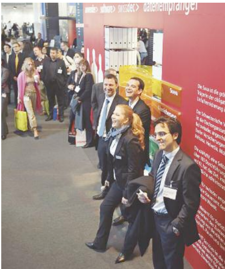
Aufgeräumte Stimmung: Das Markttreiben an den Ständen lässt den Adrenalinspiegel der Besucher ansteigen.

Noch einen Schritt weiter in Richtung geringe Einstiegskosten und wenig Einführungsaufwand geht NorthgateArinso mit seiner On-Demand-Talentmanagement-Lösung, die an der Personal Swiss als Neuheit