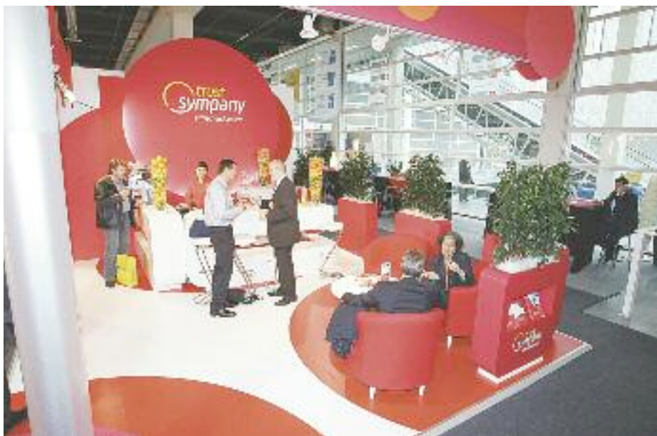
In der Krise gefragt: langjährige Partnerschaften im Bereich Unternehmensversicherungen.

halten so neue Handlungsperspektiven im Führungsalltag.