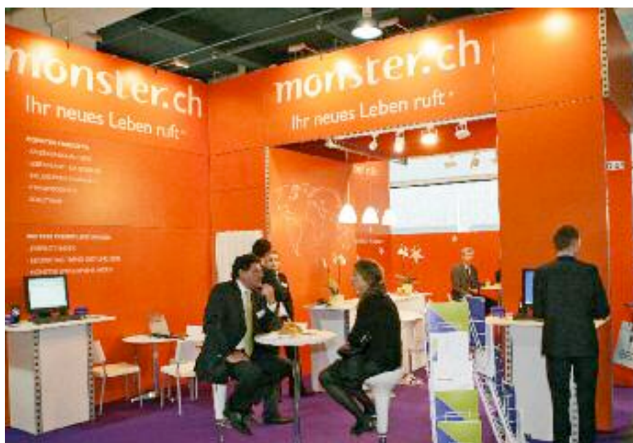
Rekrutierungsmanagement: am Stand von Monster ein heisses Thema.