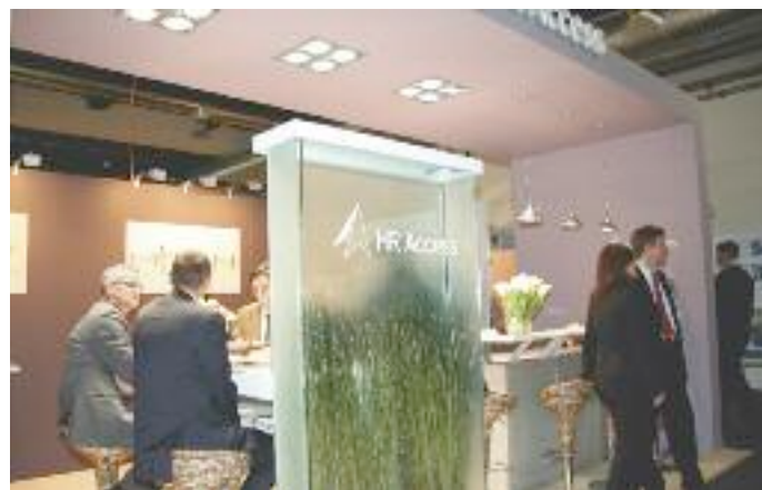
Für höchste Ansprüche: Die neue HRa-Suite 7 bietet Spitzentechnologie und Spitzenresultate.

ches HR-Management und für Aus- und Weiterbildungsorganisationen. Die Lernplattform wurde komplett erneuert, Kompetenz- und Wissensmanagement-Szenarien wurden teilweise aktualisiert.