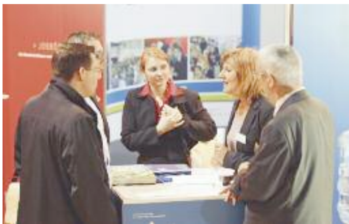
Weiterbildung: Psychologische Kompetenz ist wichtiger Bestandteil in HR-Ausbildungen.