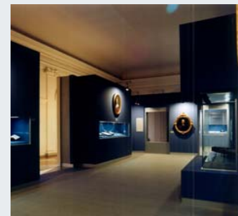
'Sophie Charlotte' Orangerie des Schloss Charlottenburg, Berlin