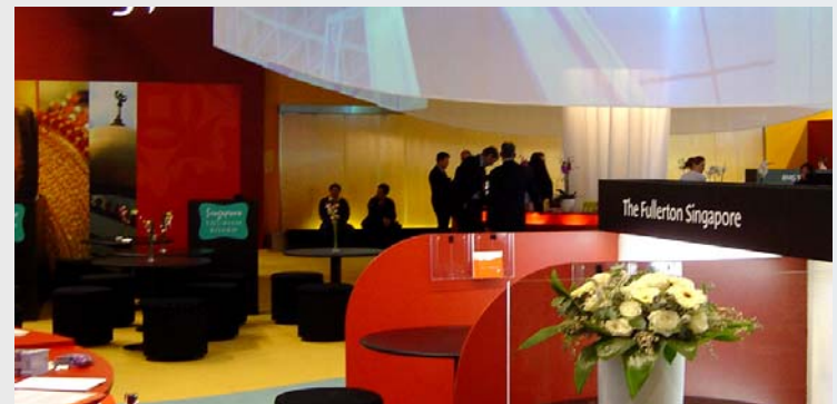
Singapore Tourist, ITB Berlin

Bei der individuellen Planung konzipieren wir frei von Bausystemen- unsere Kreativität kann sich voll und ganz auf die stimmige Inszenierung der Unternehmen unserer Kunden, Ihrer Institution und Ihrer Produkte konzentrieren.