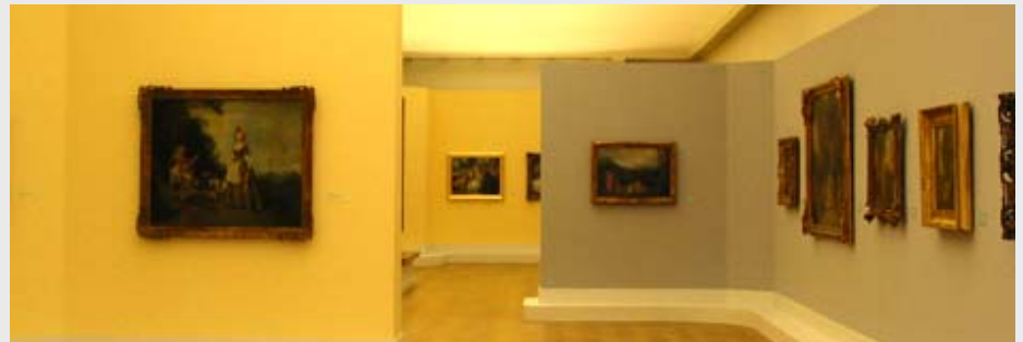
Französische Genre-Malerei Altes Museum, Berlin

Von der Jubiläumsausstellung des Verbandes der Deutschen Ingenieure in Berlin, über die 150 Jahr-Feier der Deutschen Bahn in Nürnberg, dem Gold der Skythen aus der St. Petersburger Eremitage in München, dem Gesamtausbau des Museums für Europäische Kulturen bis zur 'Poesie des Augenblick' im Alten Museum Berlin, steht fairform für erfolgreichen Ausstellungsbau.