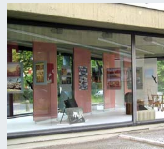
Museum Europäischer Kulturen- Staatliche Museen zu Berlin, Eröffnung