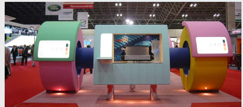
Durma, Motor Show Tokio since 1997

Museum für Europäische Kulturen Nike Park EURO 2000 Osram GmbH, weltweit Panasonic Hamburg Senat von Berlin RTL 2 GmbH & Co. KG RWE-Dea AG Singapore Tourist Promotion Board SONY Köln GmbH Suez Eurawasser Stiftung Preußische Schlösser und Gärten Berlin-Brandenburg T-Mobil Deutschland GmbH Wirtschaftsförderung Brandenburg