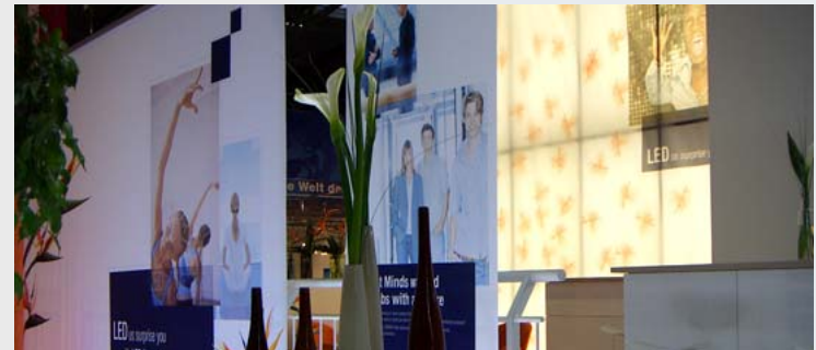
Osram, Trade Fair design worldwide since 2002

Sowohl an unserem Firmensitz in Berlin als auch an unseren Standorten in Osteuropa und Vorderasien halten wir Lagerkapazitäten vor. Über unsere weltweit vertretenen Partner können wir darüber hinaus an allen globalen Messeplätzen Lagerhaltung bieten.